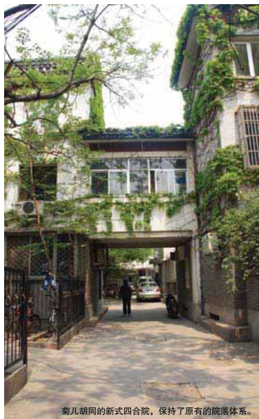
菊儿胡同的新式四合院，保持了原有的院落体系。