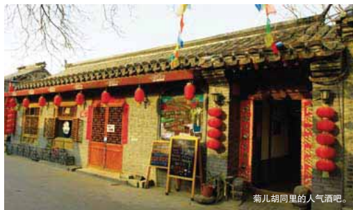
菊儿胡同里的人气酒吧。