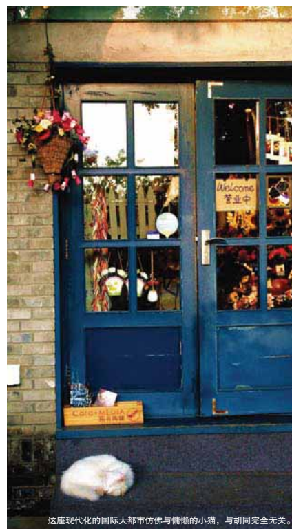
这座现代化的国际大都市仿佛与慵懒的小猫，与胡同完全无关。