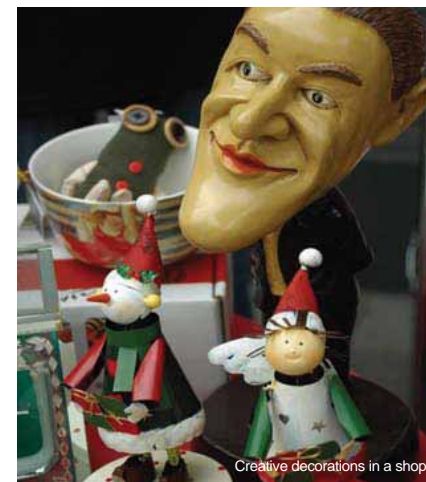
Creative decorations in a shop

Besides migrant artists, there are also many college student artists. The Central Academy of Drama, a factory for young