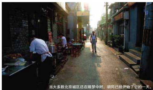
当大多数北京城区还在睡梦中时，胡同已经开始了它的一天。