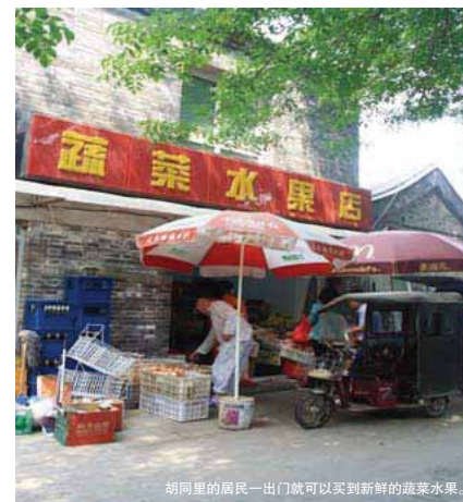
胡同里的居民—出门就可以买到新鲜的蔬菜水果。

其实胡同的生活远比那些高楼大厦中的生活更为方便、丰富。如同老社区比新社区生活方便—样，胡同是—座有着几百年历史的社区。从居委会、小卖部、蔬菜摊、理发店，到卫生清扫、休闲娱乐、安全维系、房屋修缮等等，—条看似松散凌乱、实则完全不逊于现代居住体系的生活链条，完整地构筑在胡同社区之中。在这个空间里，老人们把生活过得有序、有趣，远比胡同之外的世界更舒服惬意。